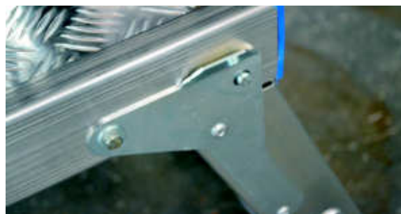
Particolare cerniera - Hinge detail

STEP is completely in aluminum , including the antislip platform , this allows it to be used in many areas of work, can also be used where there oil or liquid substances (workshop, garage, car repair, chemical industry,...). 250 kg load permitted and mm 425 platform width , that allow two operators to work simultaneously. Is foldable . Packaging in shrink wrap.