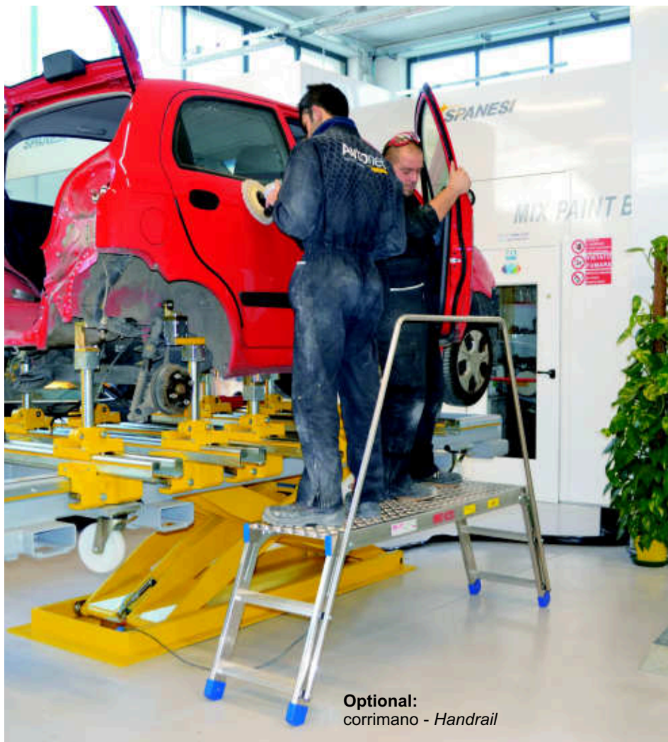
Optional: corrimano - Handrail