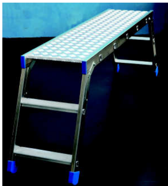
Piattaforma in lamiera mandrolata di alluminio. Grooved aluminium platform