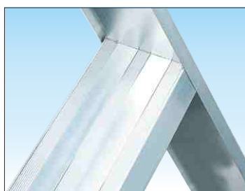
Gradino profondo 83 mm. superficie anti-scivolo per Scale 1969 - 1969S