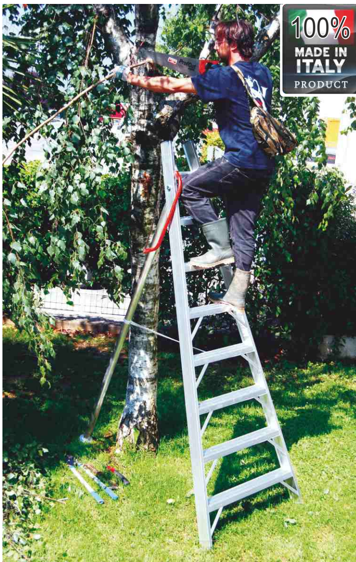
In foto articolo SCA 1969S/08 (con punta tagliata)