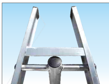
Punta tagliata consente di ridurre gli ingombri - solo per Scala 1969S