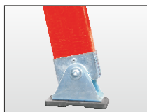
Piedino basculante anti-scivolo con box di protezione a montante.