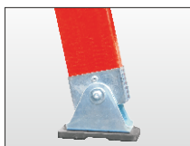
Piedino basculante anti-scivolo con box di protezione a montante.