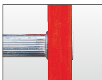
Attacco piolo-montante con doppia bordatura.