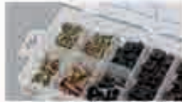
Dadi & viti per carrozzeria