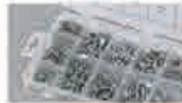
Viti per legno