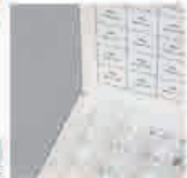
Guarnizioni in alluminio