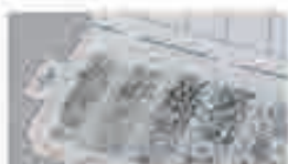
Dadi in acciaio metrici