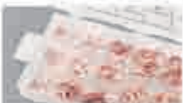
Guarnizioni in rame