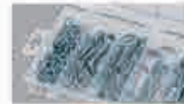
Ganci e viti ad anello