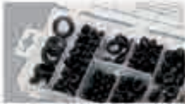
Passacavi in gomma