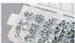
Dadi autobloccanti, UNC