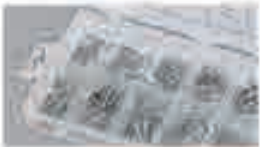
Viti per legno e metallo