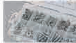
Viti per la lamiera, legno e a macchina