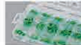
O-Ring HNBR per climatizzatori