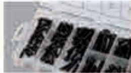
Viti a esagono incassato