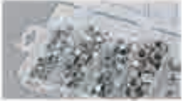
Dadi autobloccanti, UNF