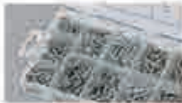
Viti a testa svasata per lamiera