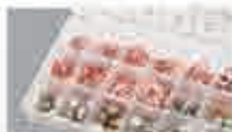
Viti scarico olio e guarnizioni